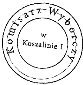
(miejsce na pieczęć Komisarza Wyborczego)

Postanowienie wchodzi w życie z dniem podpisania.